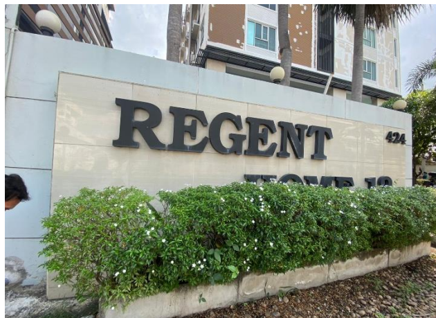
รูปที่ 1-2 สภาพปัจจุบันของโครงการ

ปัจจุบันโครงการได้เปิดดำเนินการแล้ว เป็นอาคารอยู่อาศัยรวม (อาคารชุด) ขนาดพื้นที่ 1-0-52 ไร่ ขนาดความสูง 8 ชั้น จำนวน 1 อาคาร ความสูง 22.92 เมตร (ความสูงที่ระดับพื้นชั้นดาดฟ้า) มีจำนวนห้องชุดพักอาศัย 172 ห้อง